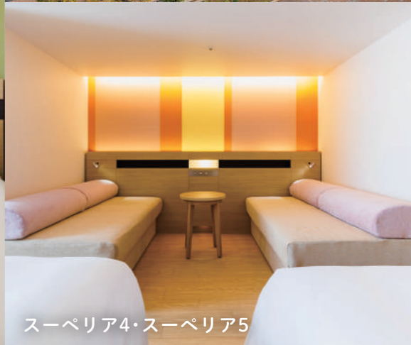
スーペリア4・スーペリア5