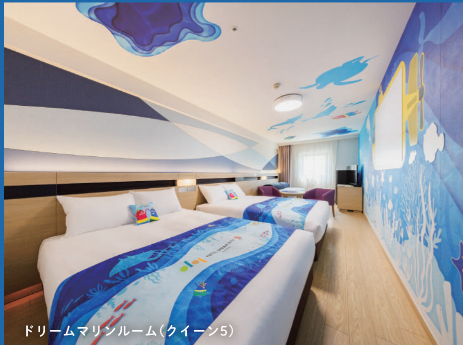
ドリームマリンルーム(クイーン5)