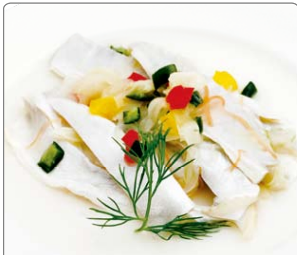
鱈のマリネ・彩野菜添え