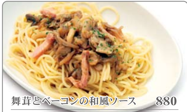
舞茸とベーコンの和風ソース 880 ドリンクバー付き +280