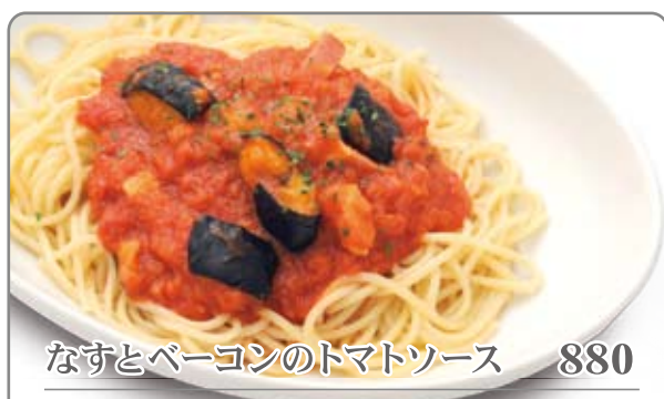
なすとベーコンのトマトソース 880 ドリンクバー付き +280