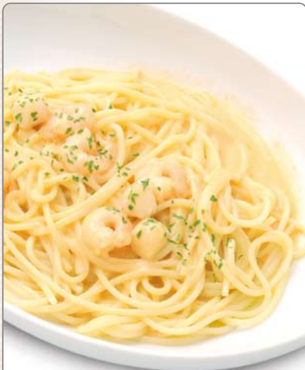
えびのクリームソース 880 ドリンクバー付き +280